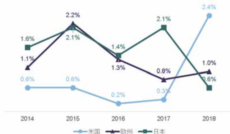
図 1 のれんの費用化の程度の推移

下記図 1 のように、2014 年から 2018 年に認識された減損損失に基づく、のれんが完全に費用化されると示唆される期間の結果は、米国：122 年、欧州：78 年及び日本：64 年でした（下記比率の平均の逆数から算出）。